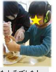
制作やお菓子作りも上手でした!