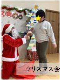
クリスマス会は、こども達も一緒に準備しました!