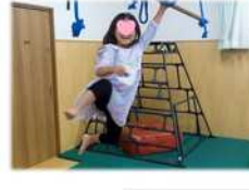
プレイルームや芝生でもいっぱい遊びました!