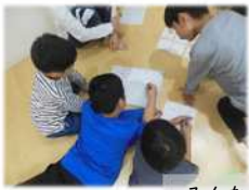
みんなで協力できました!