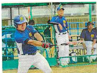
ソフトボール知覚 電知・感・四興・晋を放音師の下、ハラスンが、!!太田日吉を相手投手に、!

10月26日(土)~28日(月)に開催された、第23回全国障害者スポーツ大会「SAGA2024」にすてっぷから1名、ソフトボール競技で出場され、最終成績4位で大会を終えられました。