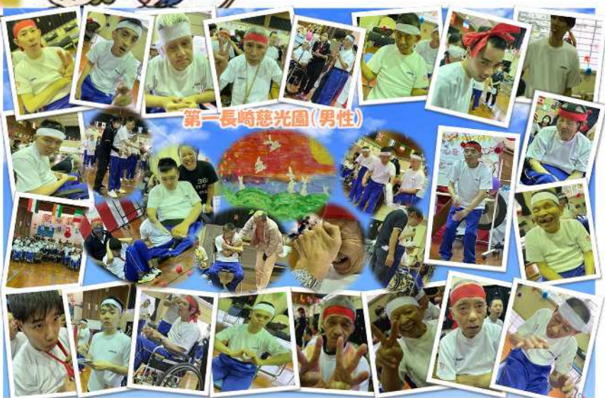
第一長崎慈光園(男性)