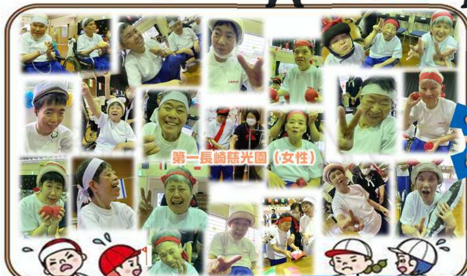
第一長崎慈光園(女性)